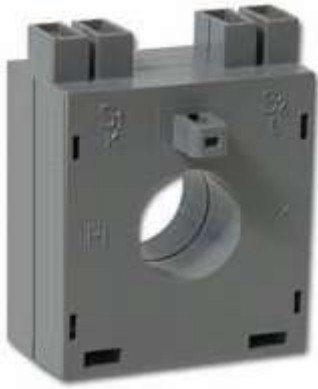
STROMWANDLER TM 1