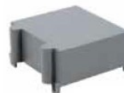
Klemmenabdeckung im Lieferumfang enthalten

andere Übersetzungen / Genauigkeitsklassen (0,2 / 3P) auf Anfrage