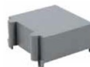
Klemmenabdeckung im Lieferumfang enthalten

andere Übersetzungen / Genauigkeitsklassen (0,2 / 3P) auf Anfrage