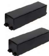
Klemmenabdeckung im Lieferumfang enthalten

andere Übersetzungen / Genauigkeitsklassen (0,2 / 3P) auf Anfrage